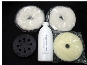
ハッピーポリッシュシステム 初期導入セット