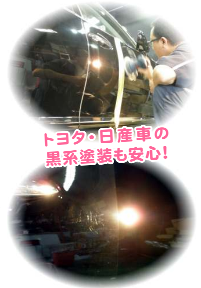
トヨタ・日産車の黒系塗装も安心!

今や、磨きは誰でも出来る! シングルポリッシャーのような、重たくて扱いにくいやり方はもう古い! 軽くて扱いやすいWアクションポリッシャーで、速く楽に美しく磨けます! 近年の高品位塗装(日産スクラッチガード、トヨタ202など)の登場で、黒系塗装の磨き仕上げが難しくなっています。これは、弾性に富んだ収縮性の高い性質である為、熱をかけるような従来のポリッシュスタイルでは、オーロラマークと言われるパフ目が出て、仕上がりが悪くなってしまいます。 では、どうしたら上手く磨けるのか? プロに任せるか、高価な磨きシステムや、専用の業務用ポリッシャーが必要なのか? 答えは、一切必要ありません。安価な市販ポリッシャーや、お手持ちの機械でも十分対応できます。 従来スタイルでは、道具を変え、人を変え、材料を変え、手間をかけてもコストと時間がかかるだけ。 このシステムでは、「誰でも簡単に!」をテーマに開発し、車磨きが楽しくできるようになりました。 磨くポイントと方法が解れば、プロを上回る品質で簡単に磨く事が出来ます。しかも、安価なシステムでありながら、高価なボディガラスコートを凌ぐ美しさをご自分の手で手に入れる事が出来ます。 私達は、日頃現場で施工している者として、費用を抑えながら高効率で技術収益を図る研究を行っております。現場の声から生まれた磨きのシステムです。 皆様も笑顔になれる、この磨きシステムをぜひご活用下さい。